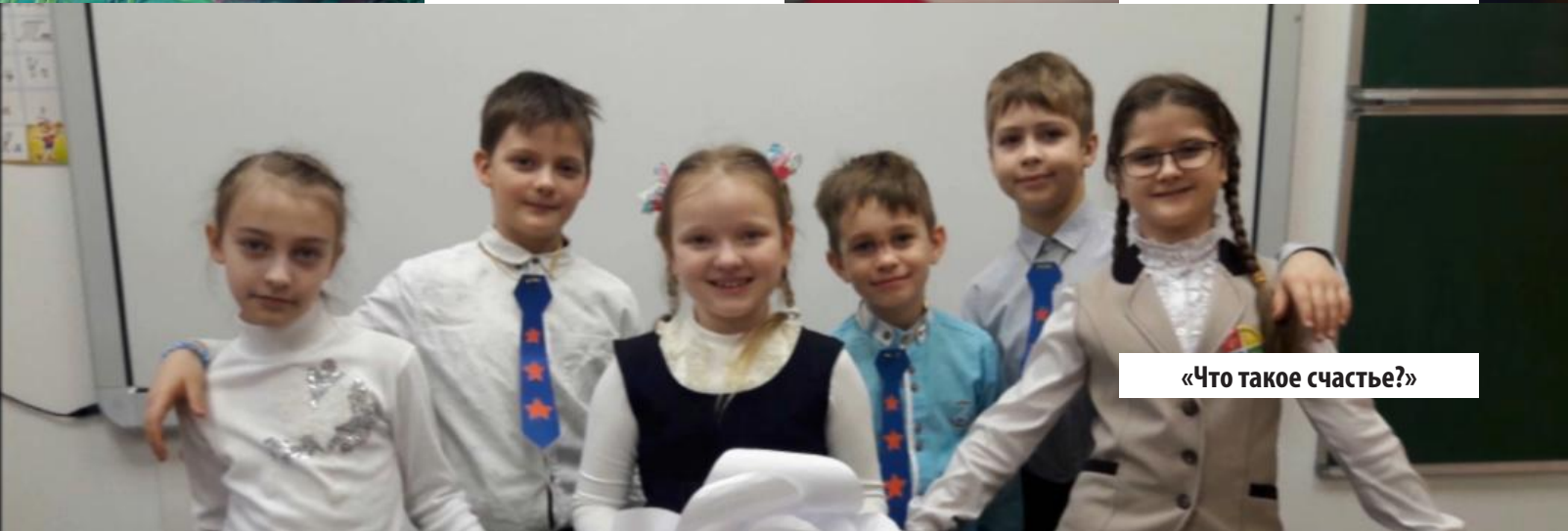
«Что такое счастье?»